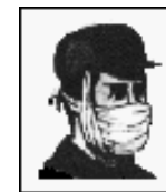
Ватно-марлевая повязка (ВМП)