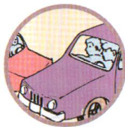
СТОЛКНОВЕНИЕ ТРАНСПОРТНЫХ СРЕДСТВ