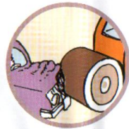
НАЕЗД НА СТОЯЩЕЕ ТРАНСПОРТНОЕ СРЕДСТВО